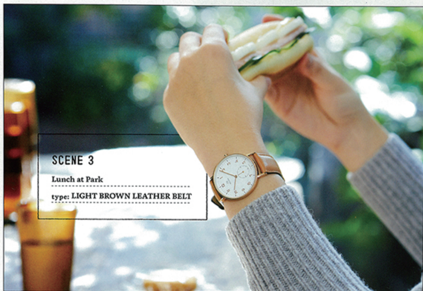
SCENE 3 Lunch at Park type: LIGHT BROWN LEATHER BELT