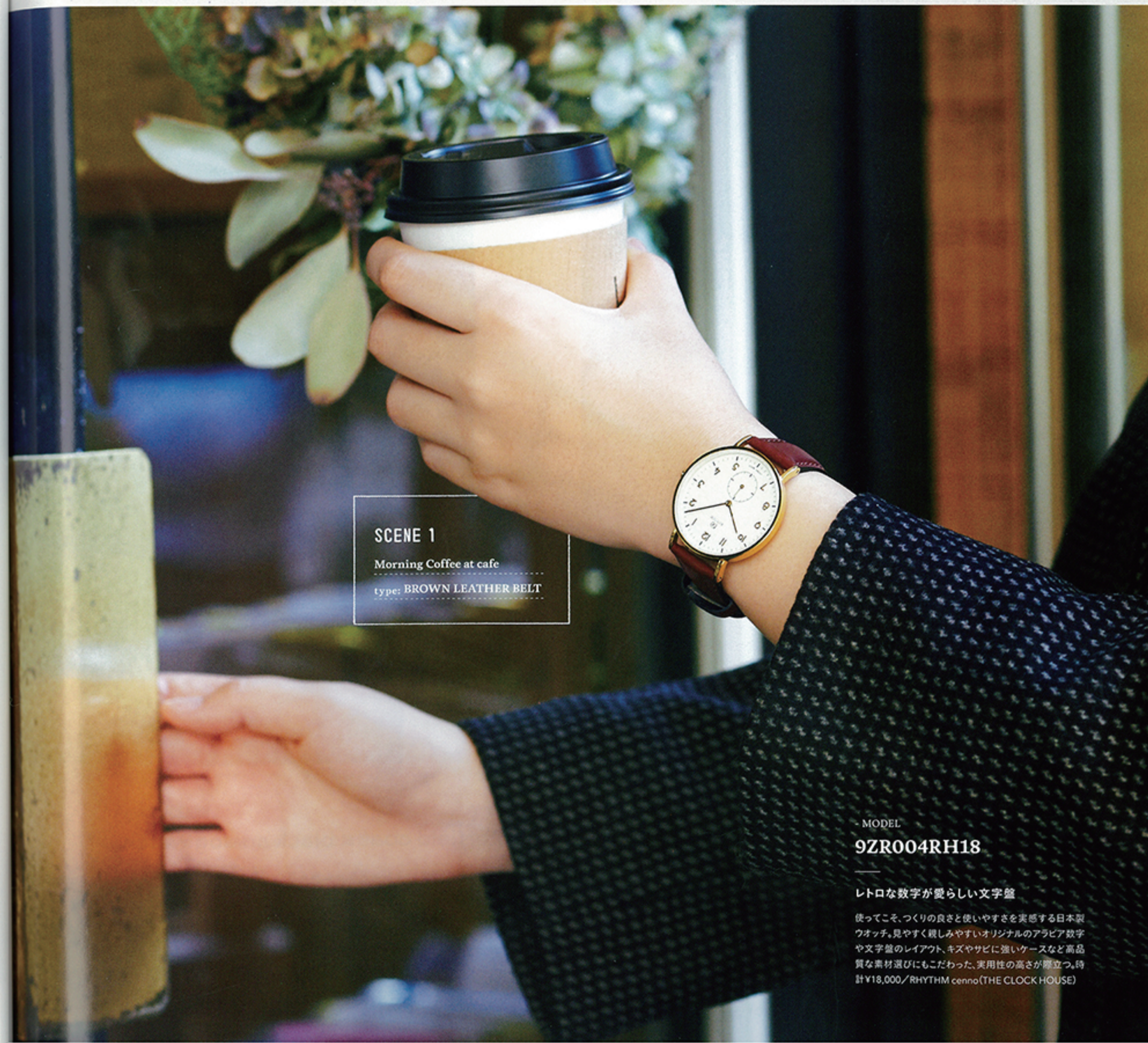
SCENE 1 Morning Coffee at cafe type: BROWN LEATHER BELT

日々の生活に欠かせない腕時計こそ、シンプルで使い心地のよいものを選びたい。そんな願いを叶える、老舗クロックメーカーならではの、使いやすさにこだわった上質な腕時計ブランド(チェンノ)が誕生。