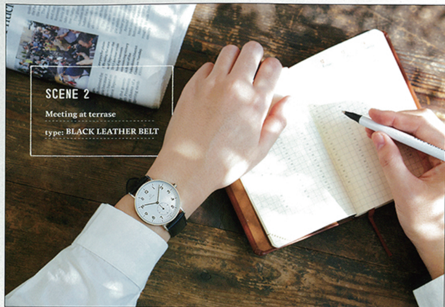
SCENE 2 Meeting at terrace type: BLACK LEATHER BELT

カジュアルにもフォーマルにもマッチする、きちんとした印象が魅力のブラック。忙しいときでも、一目で時刻が分かる文字盤のデザインに、使い手への思いやりを感じさせる。時計¥18,000/RHYTHM cenno (THE CLOCK HOUSE)